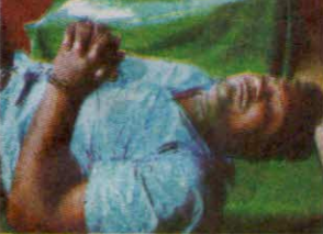
বিনাইদহে গুলিবদ্ধ অবস্থায় মাদক ব্যবসায়ী গ্রেফতার, অস্ত্র গুলি ও মাদক উদ্ধার